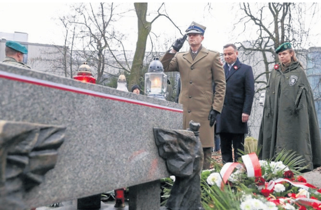
Prezydent RP Andrzej Duda 27 grudnia 2018 w Poznaniu