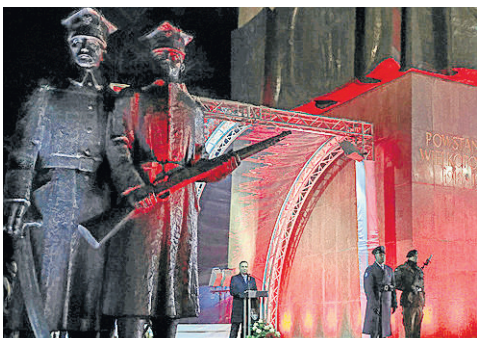
Prezydent RP pod pomnikiem Powstańców Wielkopolskich