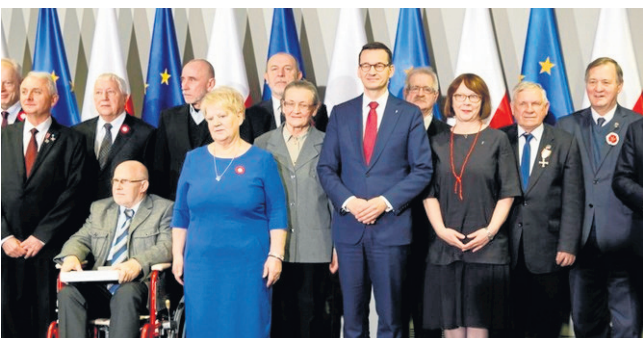
Medale 100-lecia Odzyskania Niepodległości od Premiera dla zasłużonych Wielkopolan